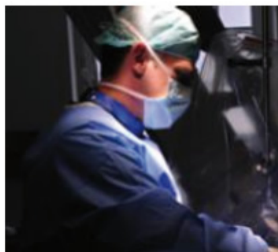
Стентирование сосудов сердца